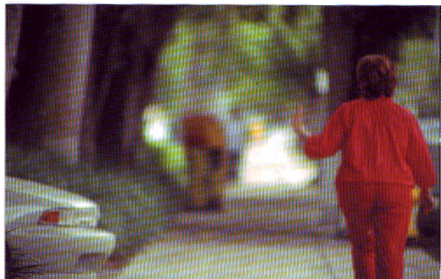
«Miami». 2002. Film 35 mm / DVD. 27'30. (Court. Air de Paris, Paris). "Miami." Film still

idéologiques. Le rôle intégrateur de la technologie et son utilisation du savoir – l'alliance entre industrie et information – ont également poussé à l'effondrement du sujet traditionnel de la critique. La théorie critique de l'École de Francfort n'a pas produit d'alternative à la notion inopportune d'autonomie, qu'elle s'applique à la théorie critique ou à l'esthétique.