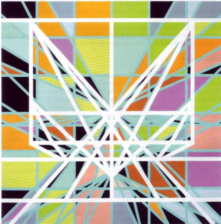
En haut : «Miami». 2002. Film 35 mm / DVD. 27'30. Film still Ci-contre : «Pools - Fontainebleau II (Miami)». 2003. Peinture industrielle sur toile, 214 x 214 cm. (Court. galerie Air de Paris, Paris). Household paint on canvas